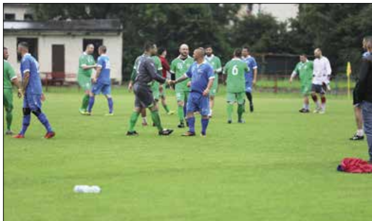
Podanie rúk po záverečnom hvízde v zápase ZSSK CAR-GO – FS.