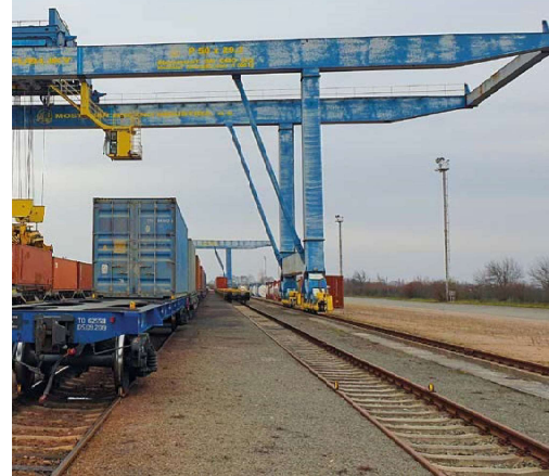
Portové žerňavy s nosnosťou 50 ton. Sú použité pre kontajnerový transšipment v TKD Dobrá.