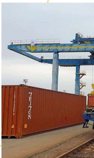
Na prekládku kontajnerov slúžia v TKD Dobrá dva portové žerňavy s nosnosťou 50 ton.